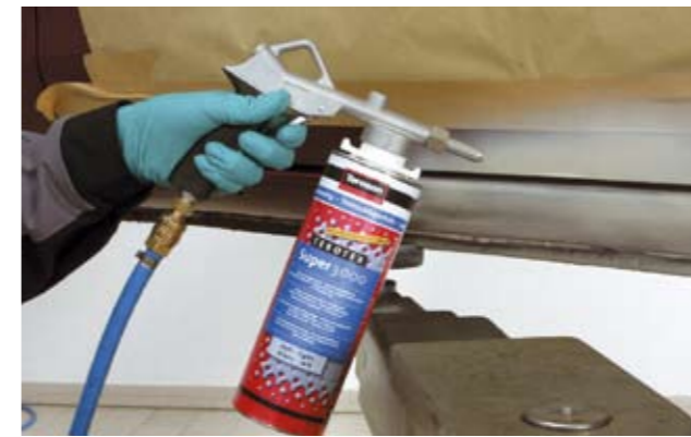
Terotex-Super 3000 Jasny