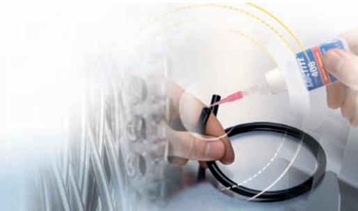
Tabela doboru produktów